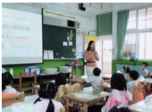
專輔進行上課規則說明

專輔第一次進行班級輔導，在暖身活動時與學生先進行課程約定與獎勵制度的說明，上課前發下每位學生姓名立牌，讓專輔在課堂上能夠叫出學生的名字，若學生在課堂有發生特殊狀況，方便下課時與導師進一步討論。說完約定進行學生宣講的繪本內容回顧與提問引起動機，學生記憶猶新、反應熱烈，對於專輔的提問予以大膽的猜測和假設，專輔一一予以肯定和鼓勵，透過獎勵卡的方式鼓勵之，專輔也請學生將獎卡壓在桌墊底下，一方面不會讓學生拿著獎卡完，另一方面也讓專輔可以知道那些學生已發表，藉此機會可以讓不同學生都能分享自己的想法與感受。