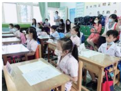
透過呼吸體驗放鬆平靜的感覺

透過繪本認識基本情緒後，以《彩色怪獸》桌遊體驗做為課程的複習，促進學生對於自我情緒的覺察與表達。邀請學生分享情緒經驗，也對於遊戲中可能會經歷失敗經驗進行重新架構，舉例來說，學生在遊戲中需要透過翻牌來確認是否將情緒放入正確情緒的罐子中，若學生翻錯，專輔對於同學勇於嘗試的精神予以鼓勵，並且為班上同學找到不同顏色的罐子，協助後續的同學可以更順利找到正確的罐子。因此在學生翻錯罐子時，班上