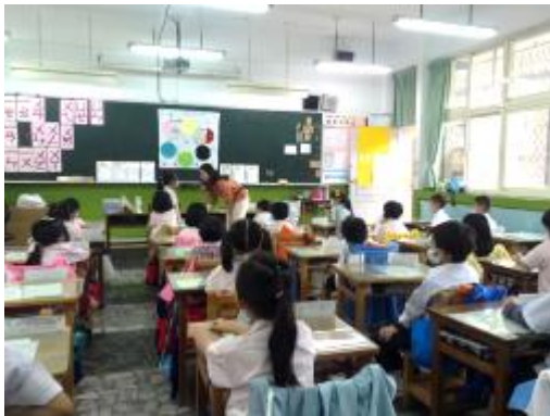
學生進行經驗分享