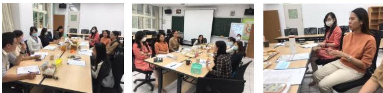
區級公開授課夥伴回饋與對話情形

課程設計的脈絡，而且在每個與學生的互動下所實踐輔導的精神與理念，透過環境氛圍的營造與輔導技巧的運用，讓學生能夠更投入於情緒教育學習，透過夥伴的回饋也讓專輔了解下次進行課程可修正之處。期許自己在每次的公開授課中，能以開放的心接納不同的觀察者看到不同的觀點，在課程設計時可以有更多的老師加入社群共同討論，讓專輔能了解現場教師與學生的互動情形，也能設計出更能夠貼近孩子的在情緒教育上的課程學習。