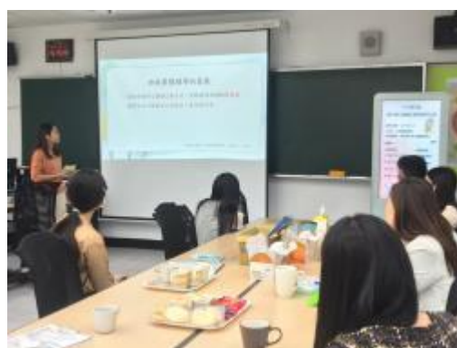
班級團體輔導的意義說明