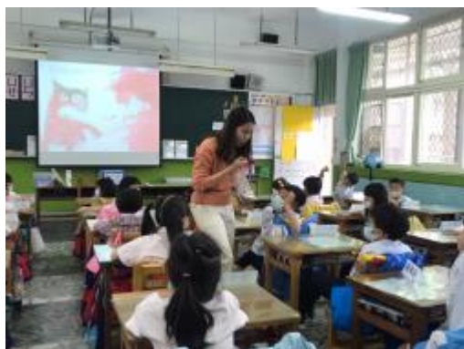
認識生氣情緒並分享情緒經驗

在認識情緒中，學生對於平靜的情緒較不容易了解，因此專輔透過呼吸的調整，讓學生將專注力放在呼吸上，並且透過引導讓學生們可以體驗放鬆的感受。在每個情緒的表達上，專輔也透過語氣讓學生能夠感受到不同情緒出現時的語調，增進學生對於情緒的辨識力。