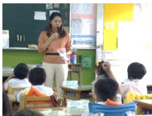
學生回答問題專輔予以獎卡肯定

暖身活動結束進入發展活動，專輔進行《彩色怪獸》繪本共讀，透過繪本認識開心、難過、生氣、害怕、平靜與幸福等心情，增進情緒詞彙，也透過彩色怪獸身上的顏色讓學生了解人本來就會有這些情緒，情緒是人天生就有的。在認識情緒的過程中，專輔會先讓學生了解彩色怪