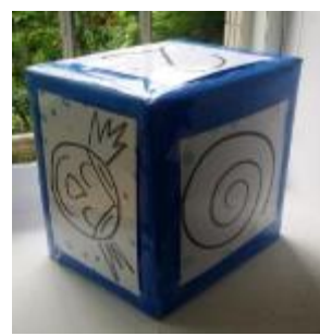
專輔手繪、手縫的自製桌遊