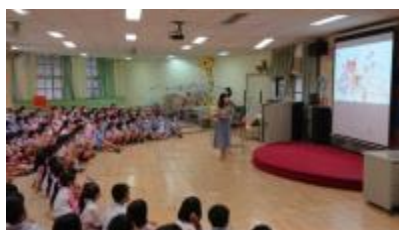
專輔進行一年級定向輔導學生宣講活動