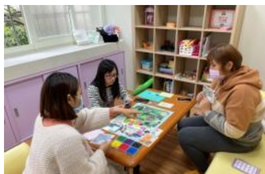
情緒教育桌遊體驗

針對情緒教育課程主題中，參考「學業與社會情緒學習協會」(CASEL) (2017)提出社會情緒學習核心能力(圖一)，該能力亦在培養學生在認知、情意與技能上，對於情緒管理的了解、對他人有同理心、建立良好人際關係、設定積極目標，並且能為自己決定負責。因此本課程也會注重學生在情緒學習上，個體對自己、他人的情緒覺察、辨識與表達，此外在對於事件的情緒因應調適能力也不容忽視，不過因為課程會針對一年級學生進行設計，因此在情緒調適能力的部分會提供更多外在資源協助學生因應情緒，在課堂中會提供學校輔導信箱的輔導資源，鼓勵學生在情緒高漲時除了運用內在調節資源、尋求導師協助等方式，也可找校內資源協助因應情緒。