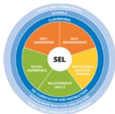
圖一 CASEL (2017) 社會情緒學習核心能力

針對情緒教育課程主題中，參考「學業與社會情緒學習協會」(CASEL) (2017)提出社會情緒學習核心能力(圖一)，該能力亦在培養學生在認知、情意與技能上，對於情緒管理的了解、對他人有同理心、建立良好人際關係、設定積極目標，並且能為自己決定負責。因此本課程也會注重學生在情緒學習上，個體對自己、他人的情緒覺察、辨識與表達，此外在對於事件的情緒因應調適能力也不容忽視，不過因為課程會針對一年級學生進行設計，因此在情緒調適能力的部分會提供更多外在資源協助學生因應情緒，在課堂中會提供學校輔導信箱的輔導資源，鼓勵學生在情緒高漲時除了運用內在調節資源、尋求導師協助等方式，也可找校內資源協助因應情緒。