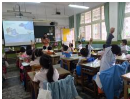
認識難過情緒並分享情緒經驗