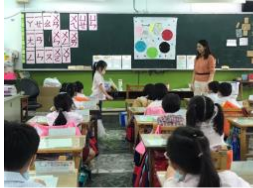
學生擲骰子進行遊戲