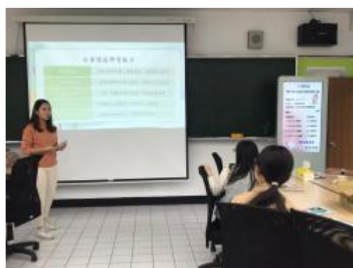
社會情緒學習能力說明

在課前會議中，專輔分享在一年級班輔前規劃學生宣講提供課程先備經驗，以新生定向輔導為主題，透過宣講讓讓學生事先認識專輔教師，也透過《彩色怪獸去上學》繪本協助學生整理的上學經驗，並且可以透過自己的經驗更協助剛開始抗拒上學的彩色怪獸，故事結束後也埋下彩色怪獸身上有許多顏色的伏筆，作為班輔的引起動機。