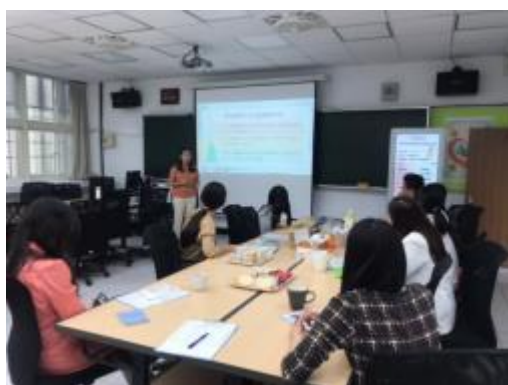
學校輔導工作三級輔導內涵說明

為了能讓學校教師更了解學校輔導工作及班級輔導相關知能，專輔在說課時針對「學校輔導工作三級輔導內涵」與「班級團體輔導意義」進行簡單說明，增加教師對於輔導工作的概念，此外，也分享在過去受輔學生的經驗及情緒教育的重要內涵。