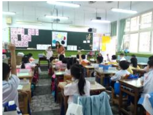
學生邀請同儕參與遊戲

最後學生們在合作之下完成桌遊任務，在課程結束前專輔進行課程總結，但因為時間的關係，總結部分沒有很完整。不過，專輔仍肯定學生在課堂上的專注，也肯定他們在進行遊戲時彼此的合作及正向語言的回饋，下課前收回名牌立牌，並給予獎勵。