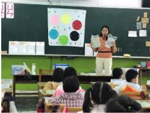
專輔說明遊戲規則

同學不會有指責，翻罐子的同學即使經歷挫折經驗仍可消化負向情緒，同時在過程中學習正向經驗。當一位同學結束遊戲，專輔請同學邀請其他同學參與活動，促進學生與其他同學的互動和連結，營造班級合作的氛圍。