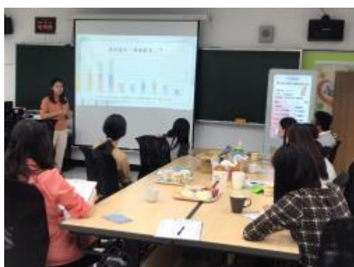
108 學年度受輔個案報表說明